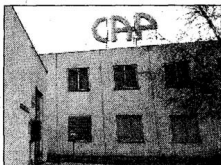
Si chiude una lunga storia

AGRICOLTURA Il Cap messo in liquidazione con due milioni di debiti